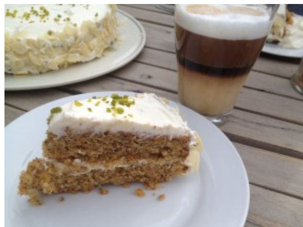
Foto und Rezept zur Verfügung gestellt von Ines Glück/Rezept Nr. 5