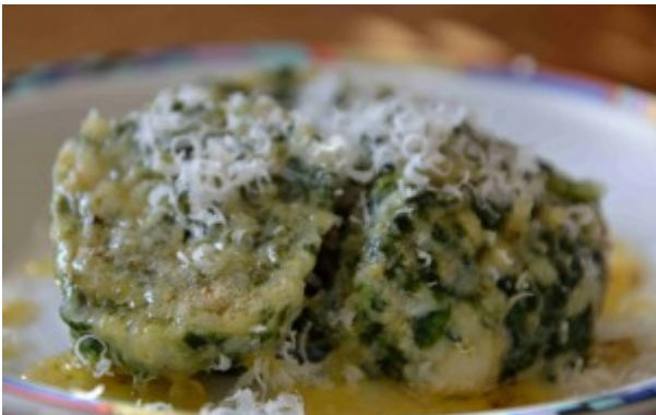
Variante 2