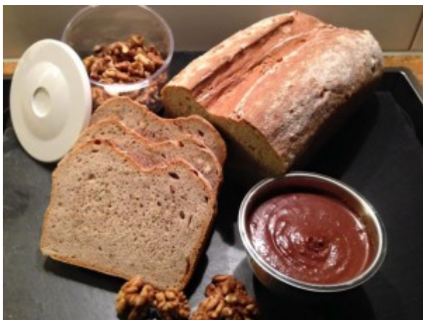
Rezept Nr. 1