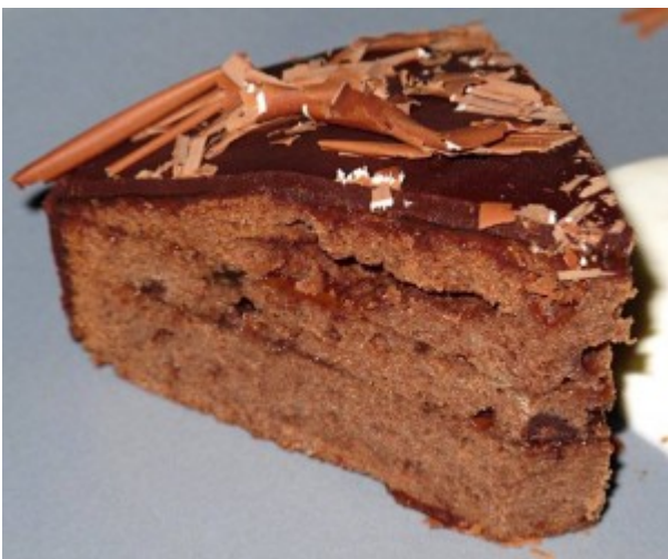
Foto und Rezept von Manfred Cuntz/Teig ist aus dem Sacher Kochbuch/Rezept Nr. 1