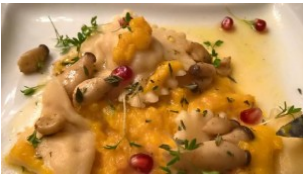
Foto: Kürbisravioli mit Kürbisragout als Sauce von Claudia Kraft nachgekocht von Claudia Kraft