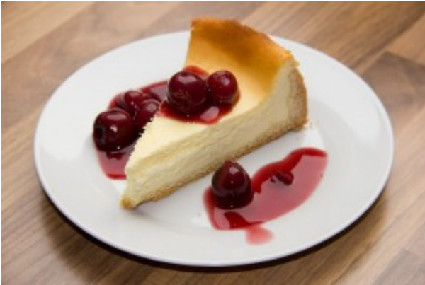
Rezept Nr. 1