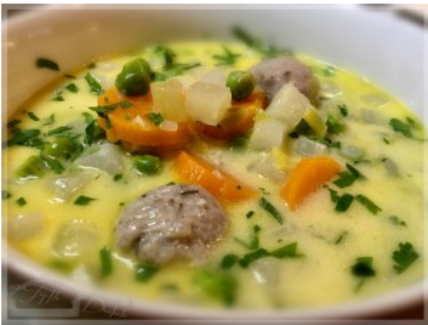
Mehr Rezepte von Dagmar findet ihr auch hier: Töpfle und Deckele