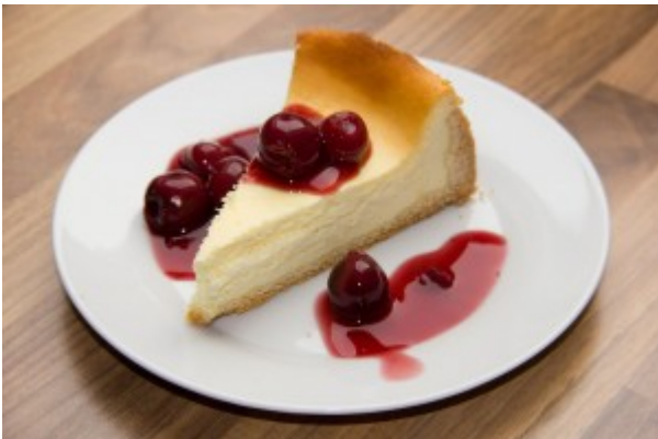
Rezept Nr. 1