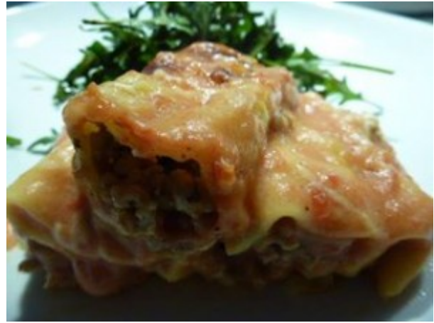
Cannelloni/Teig Nr. 1