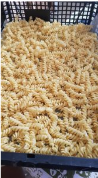
Foto Elvira Preiß , Teig Nr. 7 mit Reismehl, Maismehl, ohne Backpulver, Kartoffelstärke , Eier und Guarkernmehl etwas mehr ca 4g ,

Foto von links nach rechts: Gisela Martin, Silatelli, Teig 7/Foto Christian Schmidt, Silatelli und Rigatoni, Teig 7