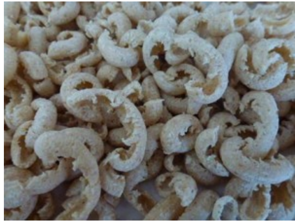
von links nach recht/Casarecce/SpaccatelliTeig 6