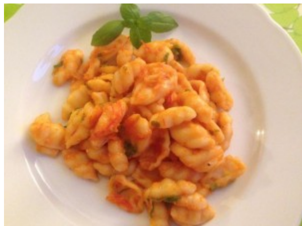
Foto Gisela Martin/1. Reihe von links nach rechts Silatelli/Orecchiette/Teig 3

Foto Gisela Martin/2. Reihe von links nach rechts Spaccatelli/Fusili/Teig 3