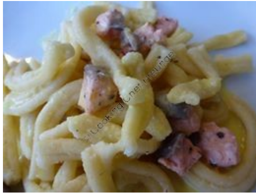
Casarecce/Casarecce im Dampfgarkorb gedämpft/Teig 3