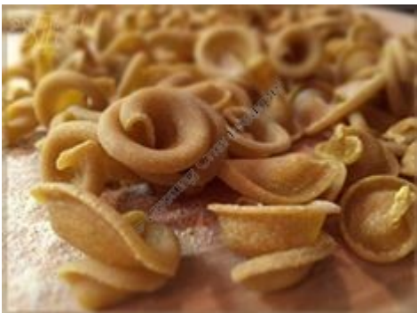
Funghi, Teig Nr. 10