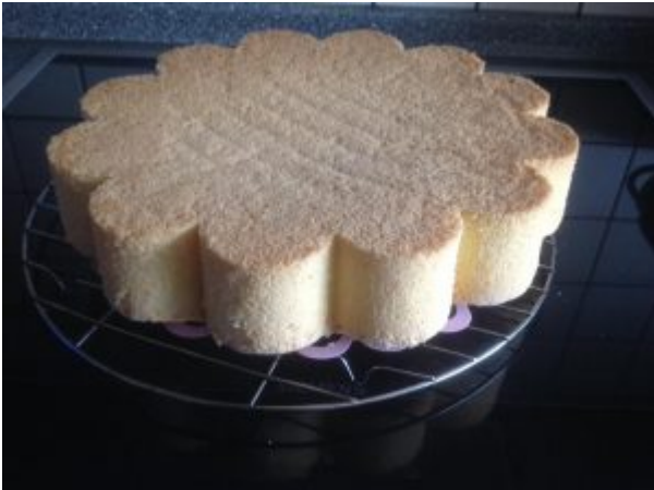
Foto Elisabeth Stauder, 29 cm Form, Rezept 2 in Variante mit K-Haken das Mehl löffelweise untergehoben, 27 Minuten Backzeit

Den Teig möglichst rasch in die Form gießen und ca 20-30 Minuten backen.