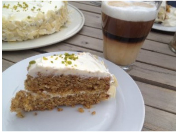
Foto und Rezept zur Verfügung gestellt von Ines Glück/Rezept Nr. 5