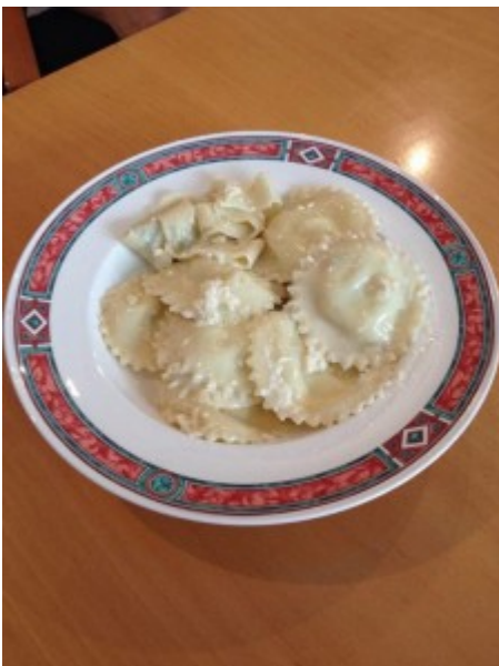
Rezept und Foto zur Verfügung gestellt von Nicole Mayerhofer