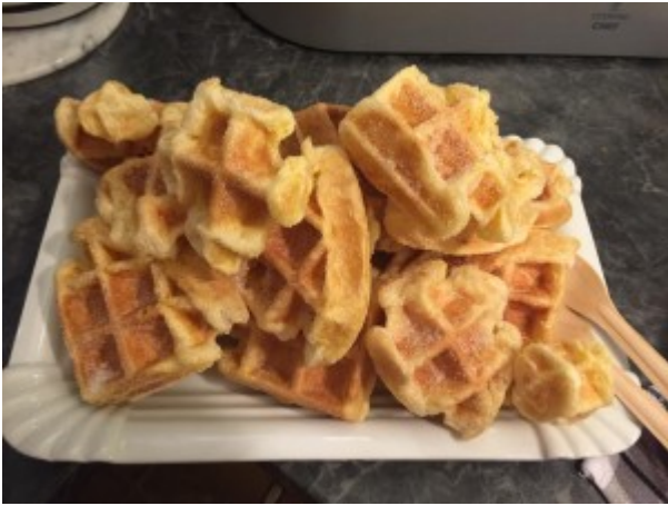
Foto und Rezept zur Verfügung gestellt von Maren Grau-Soumana Mayaki