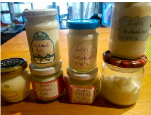
Rezept Nr. 1