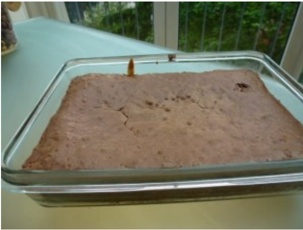
in Glasaufaufform gebacken

Am besten schmecken die Brownies in Kombination mit einer Kugel Vanilleeis... oder auch zwei.... Guten Appetit!