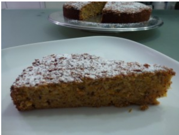
Rezept Blitz-Rüblitorte