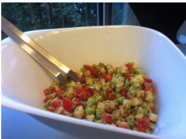
Alle Zutaten durch den Würfler gejagt und die Pinienkerne von Hand eingestreut

Rezept ursprünglich aus der Rezeptwelt, auf CC umgesetzt von einigen Gruppenmitgliedern