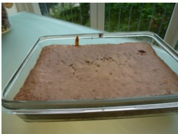
in Glasauflaufform gebacken

Am besten schmecken die Brownies in Kombination mit einer Kugel Vanilleeis... oder auch zwei... Guten Appetit!