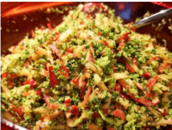
Beispiel mit Zubereitung mit dem Multizerkleinerer, Scheibe Nr. 6