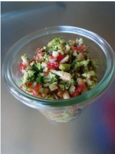
Beispiel Zubereitung mit Multizerkleinerer, Messer