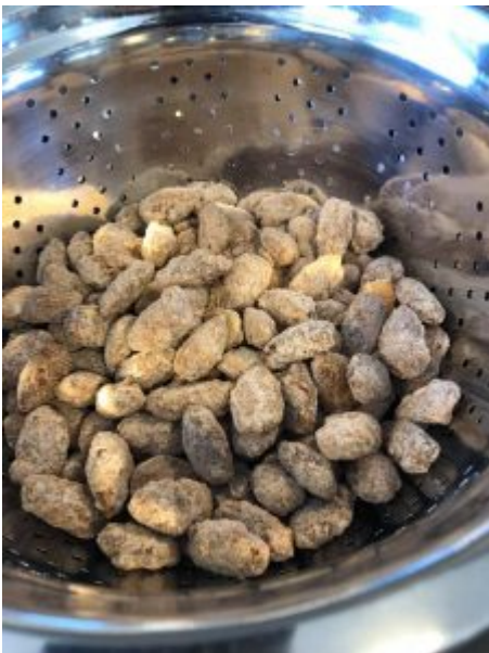
Rezept Nr. 3