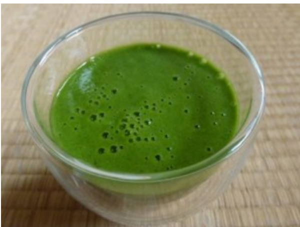
Rezept Nr. 2

Alles im Blender/Mixer gut verrühren – fertig Wem es zu scharf ist etwas mehr Gurke und Wasser dazugeben.