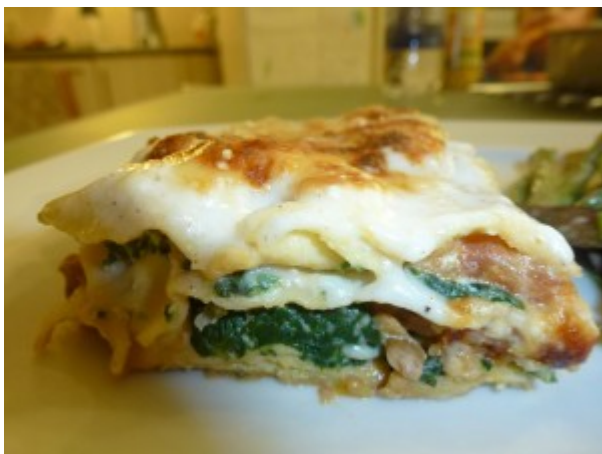
Rezept aus schwarzem CC-Buch, leicht abgewandelt/Rezept Nr. 1