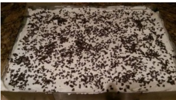
Rezept und Fotos von Claudia Kraft