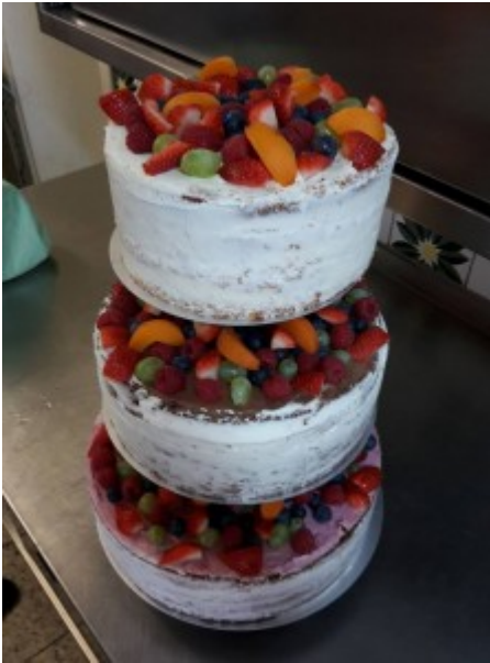
Foto und Rezepte Cremes Nr. 3-5 zur Verfügung gestellt von Birgit Lechner