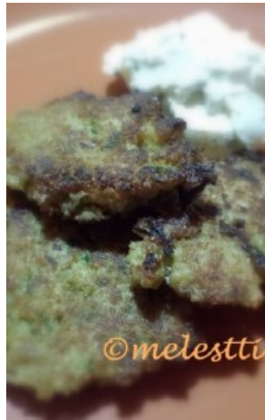
Foto und Rezept zur Verfügung gestellt von melestti (ca. 8 – 10 Stück)